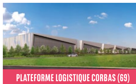
PLATEFORME LOGISTIQUE CORBAS (69)

Au cours du troisième trimestre 2018, le marché de l'investissement en France a marqué le pas, enregistrant 4,9 milliards d'euros contre 6,3 milliards d'euros au T3 2017. Cependant, grâce à un excellent 1 er semestre, le marché enregistre une hausse de 25% sur les 9 premiers mois de l'année comparativement à la même période de 2017. L'ensemble des classes d'actifs affichent de très bons résultats. Les bureaux restent la classe d'actifs privilégiée par les investisseurs : ils concentrent 70% des montants investis et affichent une hausse de 26% par rapport à 2017. Grâce à plusieurs transactions d'envergure et la vente de portefeuilles nationaux, les investissements en commerces s'élèvent à 2,4 milliards d'euros, en hausse de 14%. Les taux de rendement « prime » en bureau ont très peu évolué, ayant déjà atteint des niveaux très bas. Aucune baisse significative n'est attendue d'ici la fin de l'année. Le taux « prime » en bureaux dans Paris s'établit donc toujours à 3%.